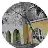
Villa Bonelli Ieri mattina una settantina di assunzioni in XI Municipio